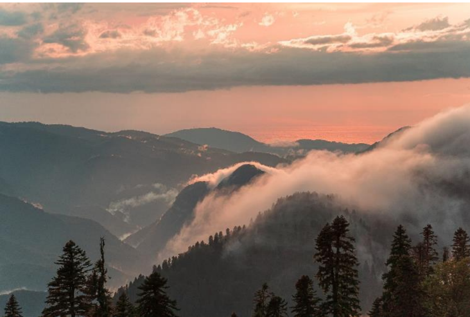
Вид на Черное море из кемпинга Нахазо