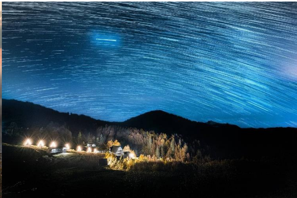
Таймлапс звездного неба над Нахазо

ЛЕТНИЕ ГОРЫ ПРЕКРАСНЫ, УБЕДИТЕСЬ В ЭТОМ САМИ